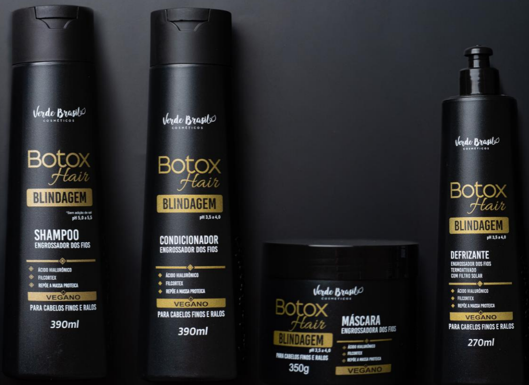
SHAMPOO CONDICIONADOR MÁSCARA DEFRIZANTE CÓD. 00010 CÓD. 00019 CÓD. 00029 CÓD. 00041 390ml 390ml 350g 270ml