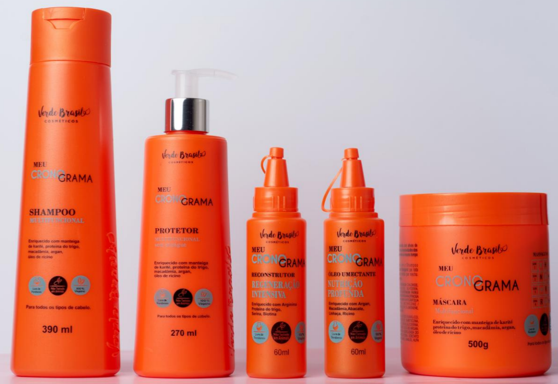
SHAMPOO PROTECTOR RECONSTRUTOR ÓLEO UMECTANTE MÁSCARA CÓD. 00014 CÓD. 00046 CÓD. 00051 CÓD. 00052 CÓD.00022 390ml 270ml 60ml 60ml 500g