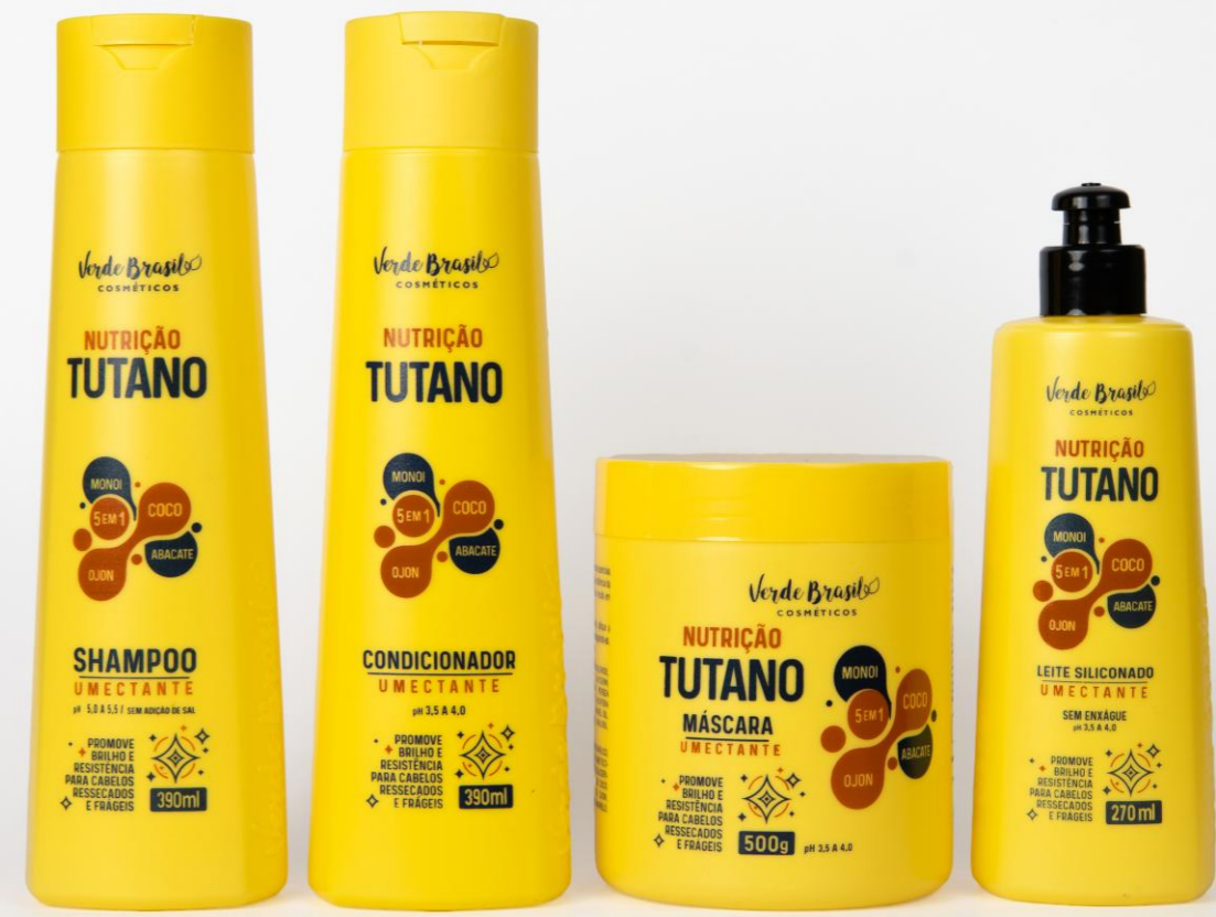
SHAMPOO CÓD. 00008 390ml CONDICIONADOR CÓD. 00017 390ml MÁSCARA CÓD. 00027 500g S/ ENXÁGUE UMECTANTE CÓD. 00137 270ml